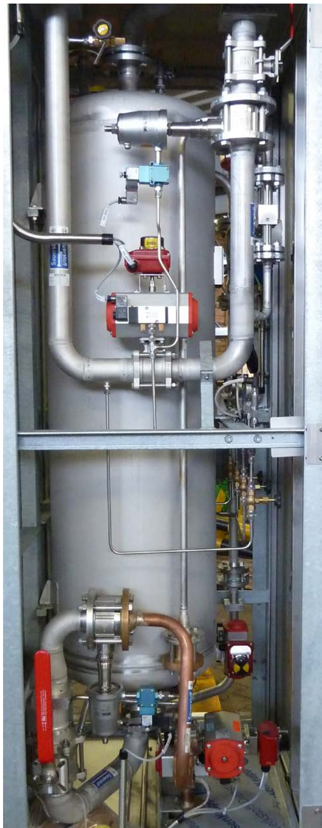
Einblick ins Innere einer SIP-Box: Zwei Gleitschieberventile vom Typ 8040 wurden im Laufe der Jahre so weiterentwickelt, dass sie in der Lage sind die benötigten Impulse mit starken Stoßwellen freizusetzen und eine Mindest-Standzeit von einem Jahr, also mehreren Millionen Schaltungen, aufweisen.

Das SIP-Verfahren hat sich am Hochofen Schwelgern 1 in weniger als zwei Betriebsjahren amortisiert und spart nun jährlich mehrere Millionen Euro an Kosten. Der Gesamtver-