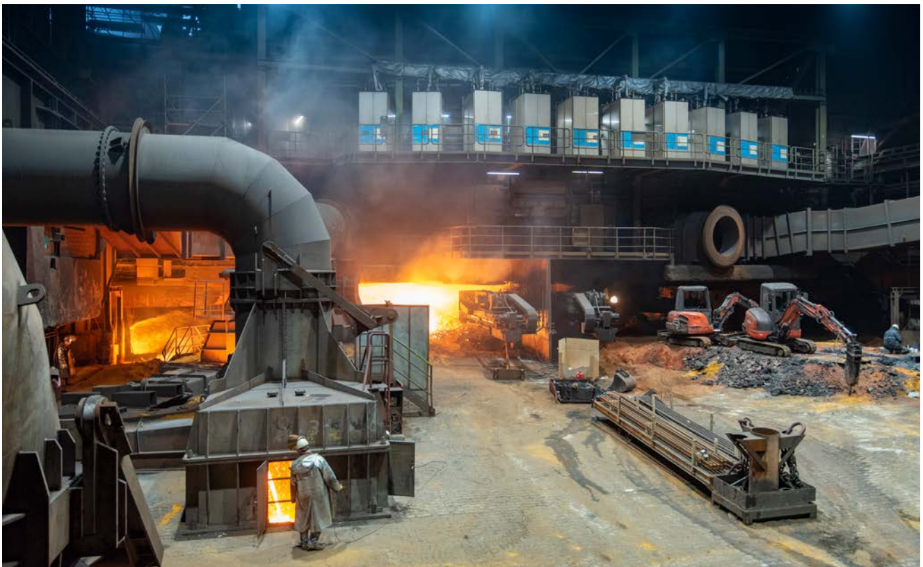
Schmelgern 1 gehört zu den modernsten Hochöfen der Welt mit einer potentiellen Leistung von 10.000 t pro Tag. An den Blasformen wurden im Laufe des Projekts 40 SIP-Boxen (grau-blau im Bild) installiert, welche starke, diskontinuierliche Impulse mit technischem Sauerstoff in das Koksbett injizieren um eine bestmögliche Tiefenwirkung zu erzielen.