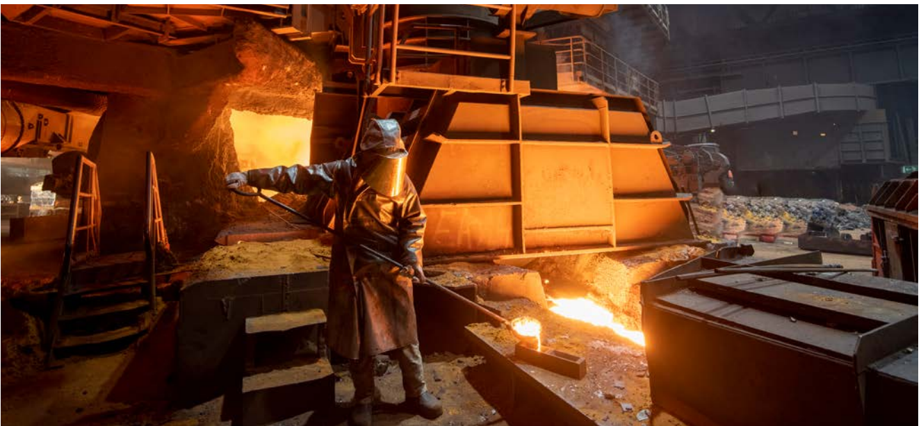
Das SIP-Verfahren hat eine deutliche Effizienzsteigerung bei der Roheisenherstellung zur Folge, spart am Hochofen Schmelzern 1 jährlich mehrere Millionen Euro an Kosten und hat sich dadurch in weniger als 2 Betriebsjahren amortisiert. Die jährlichen CO 2 Einsparungen belaufen sich auf weit über 100.000 Tonnen.